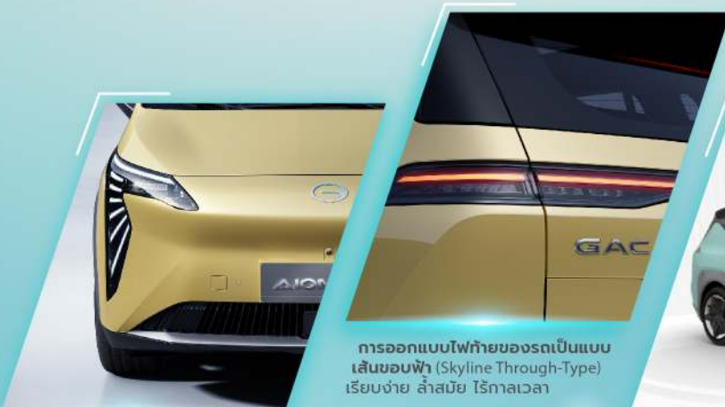
การออกแบบไฟหน้าเป็นแบบปีกนางฟ้า (Angel Wing) ที่ขยายใหญ่ขึ้นจนสะกดตา เป็นเอกลักษณ์หนึ่งเดียวของ AION Y Plus

สะกดทุกสายตา! AION Y Plus ได้รับการออกแบบตกแต่งอย่างละเอียด และมีชีวิตชีวา ด้วยรูปลักษณ์ภายนอกที่โฉบเฉี่ยว คล่องตัว ตอบโจทย์รถครอบครัวสมัยใหม่ไม่ซ้ำใคร