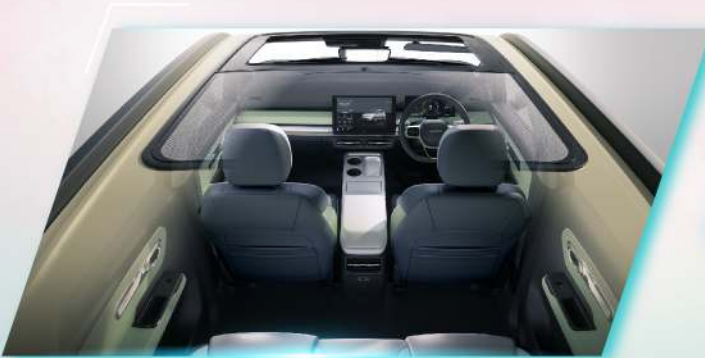
ชั้นรูปและมันบังแดดไฟฟ้าแบบพาราเมทริกขนาดใหญ่ 0.8 ตารางเมตร

การออกแบบตกแต่งภายในที่ปรับเปลี่ยนได้ถึง 5 แบบ