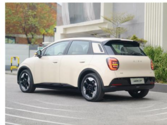
Autonomous Emergency Braking (AEB) Drive in reverse with complete confidence, even for novice drivers.