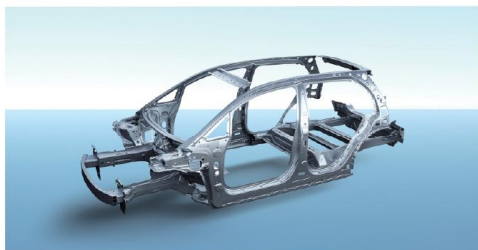
Safety body design High Strength steel comprising 71%