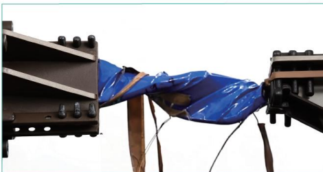
Magazine Battery 2.0 Enhanced battery performance and elevated safety standards, with fully charged battery enduring a 180-degree twist without catching fire.