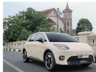
Long Driving Range Two versions available, with ranges exceeding 420km and 500km,