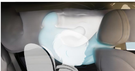
Extra-long Side Curtain Airbag 2.1-meter extra-long side curtain airbags with rollover protection, instantly and preemptively deploying upon rollover to provide comprehensive occupant protection.