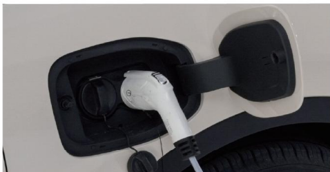
Fast Charging Replenish power from 30% to 80% in just 24 minutes.